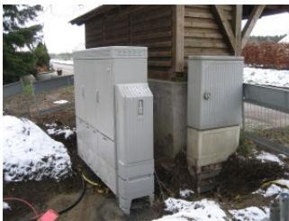
DSLAM in Sießen im Bau

Endlich ist es geschafft, unseren herzlichen Dank an all diejenigen, die zu diesem nicht selbstverständlichen Erfolg beigetragen haben.