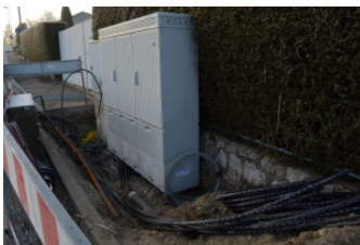
DSLAM in Bogenweiler im Bau