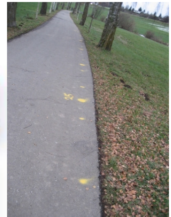
Leitungsverlauf am Sießener Fußweg

Zusammen mit Vertretern der Stadt- und Ortsverwaltung Bad Saulgau/Haid, der Deutschen Telekom sowie der Franz & Regine Frauenhoffer-Stiftung werden wir Sie darüber informieren, was bei der Breitbandversorgung erreicht wurde und Ihnen möglichst viele Informationen zukommen lassen, damit Sie selbst entscheiden können, welcher Anbieter und welches Produkt für Sie nun das Richtige sein könnte. Sie haben nun die „Qual der Wahl“